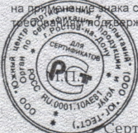
Схема сертификации Зс. Знак соответствия наносится согласно Разрешению № 06654 от 17.12.2018 на применение знака соответствия при добровольной сертификации. Соответствие обязательным требованиям подтверждено декларацией о соответствии № РОСС RU.AE81.D00031/18 от 17.12.2018.