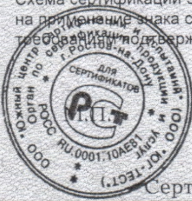
Схема сертификации Зс. Знак соответствия наносится согласно Разрешению № 06654 от 17.12.2018 на применение знака соответствия при добровольной сертификации. Соответствие обязательным требованиям подтверждено декларацией о соответствии № РОСС RU.AE81.D00031/18 от 17.12.2018.